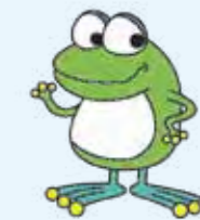
横浜市水道局キャラクター「はまびょう」