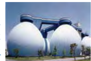
バイオガスを抽出する「卵形消化タンク」

水から取り除いた汚れ(下水汚泥)は汚泥資源化センターに集めて焼却した後、灰を公共工事で使用する土などに再利用するとともに、現在では下水汚泥を燃料にする事業も進めています。また、上記の処理過程でバイオガスを抽出し、センター内で使用する電力供給のための発電機や焼却炉の燃料などとして利用しています。さらに、余った電気は再生可能エネルギーとして電力事業者に供給しています。このように、横浜市環境創造局では、下水のすべてを資源として還元し、循環型社会への貢献を推進しています。下水処理の仕組みについては施設見学もできますので、興味のある方はお問合せください。生活の中で水を使用する際、これらのことを少し思い起こしていただき、未来の横浜市民にこの貴重な水、そして、豊かな自然を引き継いでいただければと思います。