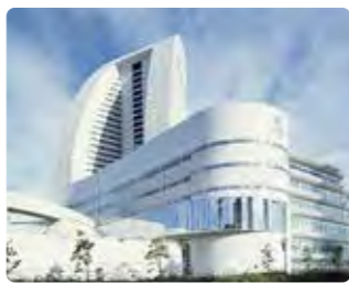
会場となるパシフィック横浜

来年3月、世界各国の研究者の参加のもと、地球温暖化に関する最新の科学的・技術的・社会経済的な評価が行われるIPCC(気候変動に関する政府間パネル、1988年設立)が、この横浜で開催されます。