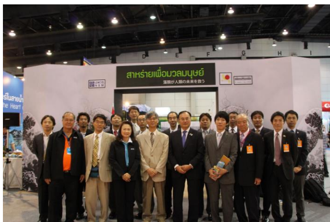
【オールジャパンでの記念撮影】

その他日本からは、JAXA(宇宙航空研究開発機構)、JIRCUS(国際農林水産業研究センター)、NICT(情報通信研究機構)、RETEC(リモートセンシング技術センター)、東海大学及びキングモンクット工科大学ラカバン、北海道大学、地球観測衛星コンソーシアム(住友商事、NEC、三菱電機、パスコの4社が、日本政府の支援の下、コンソーシアムを組成し、タイ政府に必要な情報を提供するなど、タイの宇宙分野での活動を支援しています)が出展を行いました。