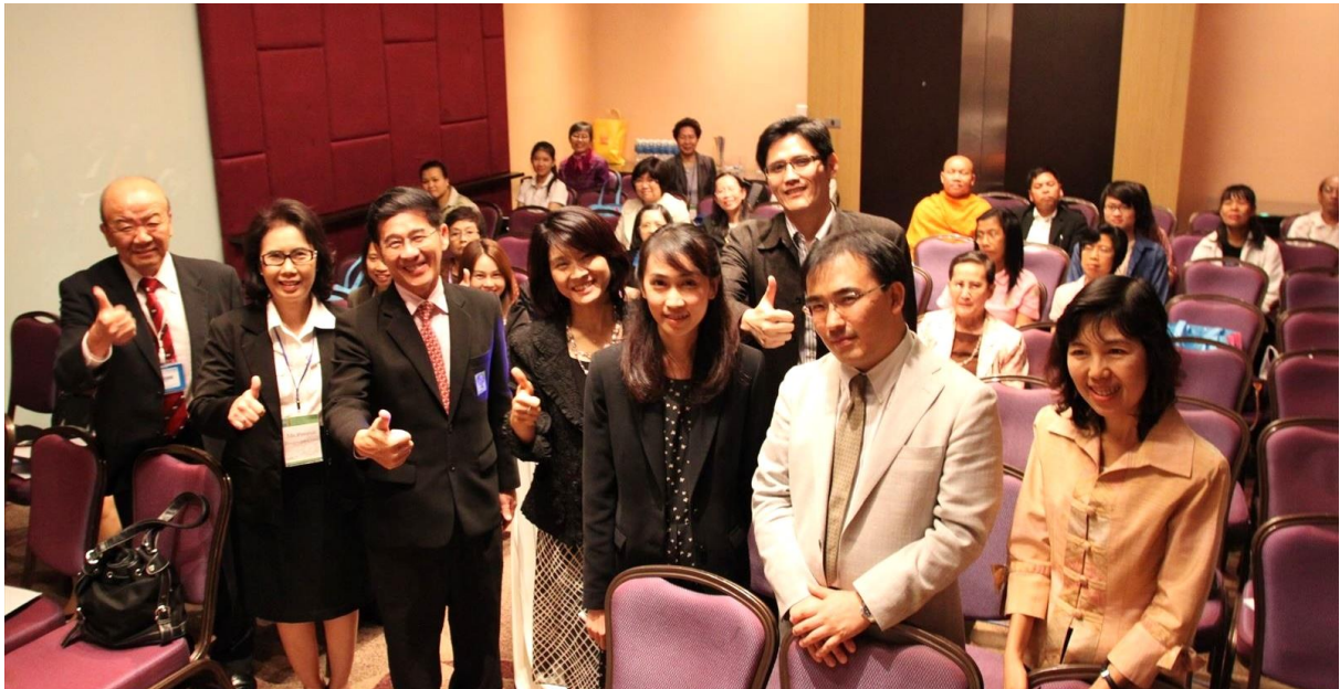
【JSPS-NRCT セミナー(8/29 実施)にて参加者全員との記念撮影】