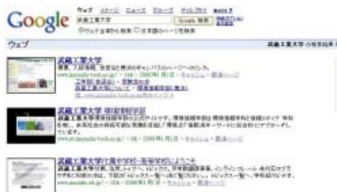
図 1. Google のプレビュー画面の表示