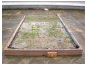
情報メディアセンター屋上 ピオトープパッケージ

株式会社 JAL ウェイズ 株式会社損保ジャパン 株式会社ウッドワン 伊藤忠エネクス株式会社 岩谷産業株式会社 JICA 青年海外協力隊(JOCV) 株式会社毎日コミュニケーションズ 株式会社ユザワヤ