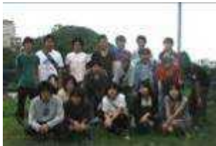
伊豆下田 2007年夏 ゼミ合宿