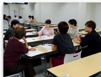
2019年度教職員と学生との協働FD懇談会の様子 (※COVID-19のため2020年度はオンライン開催)