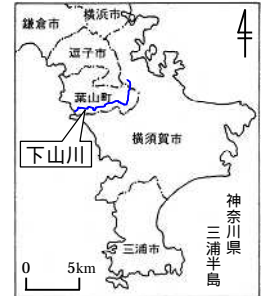
図 3-1 下山川の位置