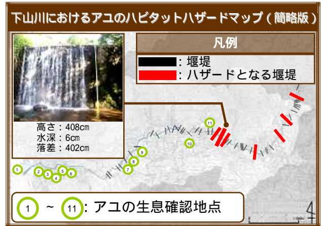
図 4-1 三浦半島下山川におけるアユの HSI モデルを用いたハビタットハザードマップ (簡略版)

い堰堤が 7 つ存在していた。これらの堰堤より上流は、HSI=0 となる。本研究の調査結果から、下山川におけるアユのハビタットハザードマップを作成した(図 4-1)。なお、概要では簡略版を示す。下山川においてハザードとなったアユのハビタット変数は、「V 7 :流水時の堰堤の落差」のみであった。