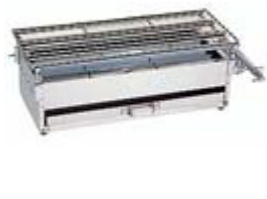
焼鳥器(3本バーナー)