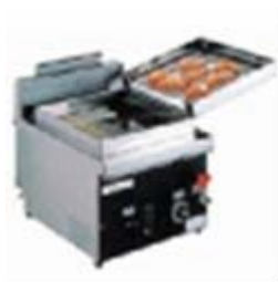
フライヤーセット