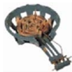
ガスコンロ(大)(特大)

レンタル料 3日 : 5,145円 ※クレープ三角袋はついてこない ので、別途購入してください。