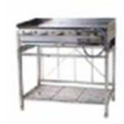
台付き鉄板焼き器

レンタル料 (84個) 3日 : 7,350円 (140個) 3日 : 11,760円