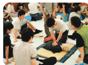
(1-3) 学生生活指導への援助:救命講習会