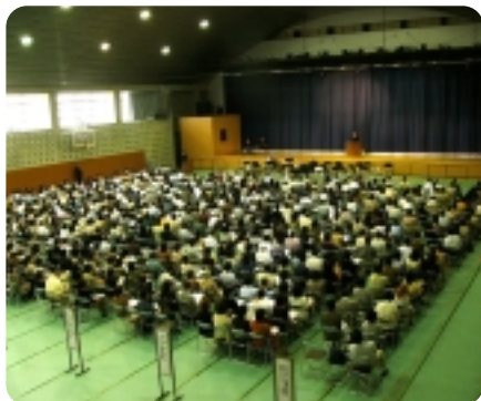
※ 世田谷キャンパスの全体説明会

武蔵工大および後援会の恒例行事である「大学と父母との連絡会」。今年も全国各地の会場に、たくさんのご父母を招いて開催されました。