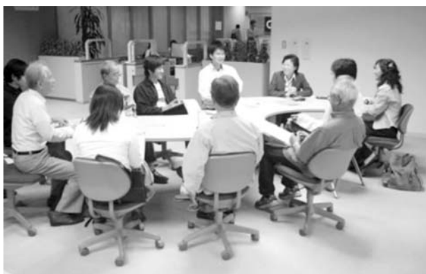
図5 教室終了後のフィードバックミーティングの様子