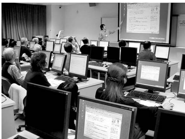
図4 パソコン教室の実施風景 (教師役の学生が説明している様子)