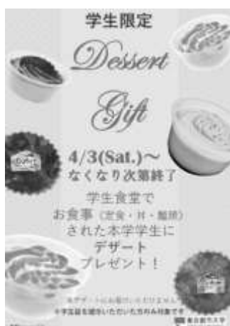
4月の イベント ポスター